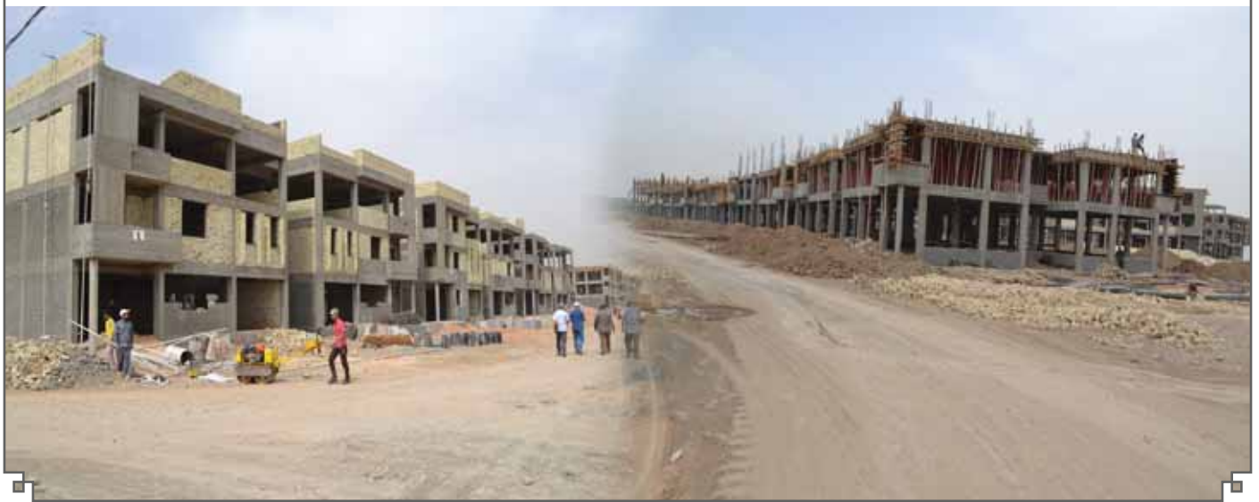
الشكل(٦):- المظهر الخارجي للمجمعين السكنيين واطي الكلفة في بابل

تتألف كل عمارة من ثلاثة طوابق يحتوي كل طابق على اربع شقق سكنية تتألف كل شقة من (غرفتين وصالة) مع ملحقات (حمام مع مرافق صحية في حيز واحد ومطبخ) ومساحة الشقة الواحدة (١٠٠ متر مربع) من البناء الكونكريتي المسلح بالطابوق.