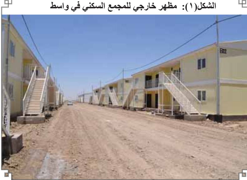
الشكل (١): مظهر خارجي للمجمع السكني في واسط

لقد رصد التحالف عددا من المخالفات والأخطاء التي أما تؤدي أو تكون سببا أو هي احد نتائج الفساد وقبل سرد المخالفات لابد من عرض طبيعة ومكونات الوحدات السكنية في هذا المجمع المخصص للفقراء، يبين الشكل (١) صورة خارجية للمجمع الذي بني من وحدات من الشقق المزدوجة الاولى ارضية والثانية بنيت فوقها بطابق ثاني يفصل بينهما سلم صغير من (١٨ درجات) شكل(٢) تتألف الوحدة السكنية الواحدة من (٣ غرف نوم) مساحة الغرف الثلاثة الكلية ٣٢ متر مربع اي مايعادل (٦,١٠ متر مربع) للغرفة الواحدة وهي مساحة صغيرة جدا لاتكاد تسع لسرير واحد ، و غرفة استقبال مساحتها ١٥ متر مربع ومطبخ مساحته ٩ متر مربع وممر وهول داخلي مساحته ٩ متر مربع وحمام (يجمع الحمام والمراحيض ومغسلة في حيز واحد ومخزن ومدخل، شكل (٣) اما