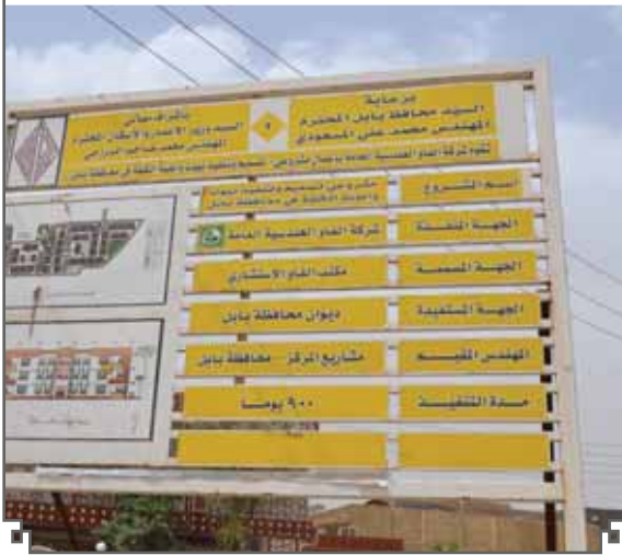
الشكل(٨):- لوحة بيانات المجمع السكني للفقراء في بابل

للعمل المثبتة في العقد وعلى لوحة المشروع وهي ٩٠٠ يوم والتي تبدأ من تاريخ إحالة المشروع في ٢٠١٢/١٢/١٥ في حين حددت الإدارة التنفيذية لخطة تخفيف الفقر في تقرير المتابعة لعام ٢٠١٣ ان مدة المشروع (٣) سنوات(٤)، وبهذا فنحن امام تناقض في التوقيتات والتواريخ. كما ان فريق التحالف طلب الحصول على جدول تقدم العمل الا اننا لم نحصل عليه بحجة انه لم تتم المصادقة عليه في ذلك. ان فريق التحالف في الوقت الذي يقدر خطر وصعوبة تسليم وثائق تخص المشروع، كما ان تجربة مراقبة ومتابعة الاداء من قبل منظمات مجتمع مدني تعد تجربة جديدة وغير معتادة في العراق الا ان التحالف كان قد حصل على الموافقة من محافظ بابل على زيارة الموقع والتعاون، فضلا عما قدمته الإدارة التنفيذية للإستراتيجية من التعاون المسبق بما يمكن ان يمنح الاطمئنان لنقاط الارتكاز في مشاريع تخفيف الفقر وابداء المرونة والتعاون اكثر من ذلك. الا انه لم تتم الموافقة حتى على التقاط صورة لجدول تقدم العمل الذي كان معلقا على جدار غرفة المهندس المقيم وهذا بحد ذاته يثير الاستغراب والتساؤلات.