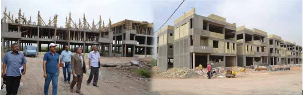
الشكل(٩): مظهر عام عن الفرق في تقدم العمل في مشروع السكن واطيء الكلفة وللفقراء في بابل

للعمل المثبتة في العقد وعلى لوحة المشروع وهي ٩٠٠ يوم والتي تبدأ من تاريخ إحالة المشروع في ٢٠١٢/١٢/١٥ في حين حددت الإدارة التنفيذية لخطة تخفيف الفقر في تقرير المتابعة لعام ٢٠١٣ ان مدة المشروع (٣) سنوات(٤)، وبهذا فنحن امام تناقض في التوقيتات والتواريخ. كما ان فريق التحالف طلب الحصول على جدول تقدم العمل الا اننا لم نحصل عليه بحجة انه لم تتم المصادقة عليه في ذلك. ان فريق التحالف في الوقت الذي يقدر خطر وصعوبة تسليم وثائق تخص المشروع، كما ان تجربة مراقبة ومتابعة الاداء من قبل منظمات مجتمع مدني تعد تجربة جديدة وغير معتادة في العراق الا ان التحالف كان قد حصل على الموافقة من محافظ بابل على زيارة الموقع والتعاون، فضلا عما قدمته الإدارة التنفيذية للإستراتيجية من التعاون المسبق بما يمكن ان يمنح الاطمئنان لنقاط الارتكاز في مشاريع تخفيف الفقر وابداء المرونة والتعاون اكثر من ذلك. الا انه لم تتم الموافقة حتى على التقاط صورة لجدول تقدم العمل الذي كان معلقا على جدار غرفة المهندس المقيم وهذا بحد ذاته يثير الاستغراب والتساؤلات.