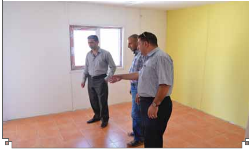
الشكل(٤):- صورة لغرفة في الوحدة السكنية تبين ارتفاع سقف الغرفة

وبما إن المجمع انشأ من قطع جاهزة عمادها الخشب فإن تعليمات السلامة المهنية الصادرة عن الامانة العامة لمجلس الوزراء في عام ٢٠١١ تحتم وجوب توفر منظومة إنذار عن الحريق ومنظومة إطفاء مركزي أو توفر مركز للدفاع المدني في نفس موقع المجمع السكني لسهولة إنتشار الحرائق الا ان المجمع يفتقر لكافة التعليمات الخاصة بسلامة المباني السكنية.