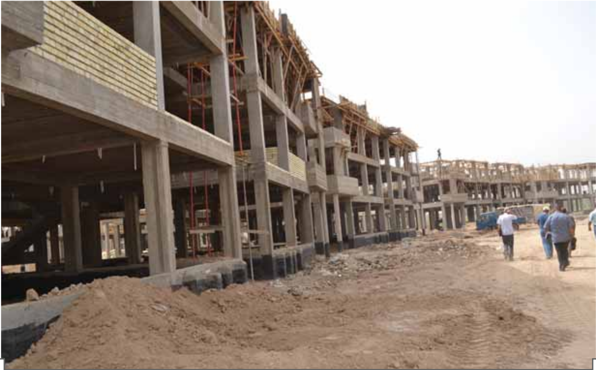
الشكل (١١): صورة عن تقدم اعمال البناء في المجمع واطيء الكلفة في بابل

غير مقبول اذا تقاربت نسب الانجاز مع نسبة الانحراف ويبين الجدول ان سنة وخمسة اشهر من العمل في المشروع وهي نصف المدة المحددة للإنجاز حسب تقرير الإدارة التنفيذية لم تصل فيها نسبة الانجاز الفعلي الى الربع في حين تم صرف ١٦٪ فقط من المبلغ المرصود لعام ٢٠١٢ وهو ١٢ مليار و ٦٠٠ مليون دينار اي مايعادل ٢ مليار و ١٦ مليون دينار فقط وهذا يبين مدى تأخير اقرار الموازنة العامة للدولة حيث مازال المشروع ينفذ بما تم تدويره من تخصيص عام ٢٠١٢ (ملحق-٣) الذي لم يصرف بأنتظار اقرار الموازنة، وقد ذكرنا في التقرير الاول ان التأخر في الحصول على الاستحقاق (سواء كان اموال او سكن او غيرها) هو نوع من انواع الفساد. وقد لاحظ المهندس الإستشاري في فريق التحالف وكما يبين الشكل (١١) ان اعمال البناء يتم تأخيرها حتى ينتهي صب البناية بشكل كامل مع ان الاستغلال الامثل للزمن والايفاء بالتزامات العقد تتطلب عدم الانتظار وبالعكس يجب ان تسير اعمال الصب في عمارة وتتنجز البناء بالطابوق في الاخرى ليسير العمل سريعا ومتزامنا.