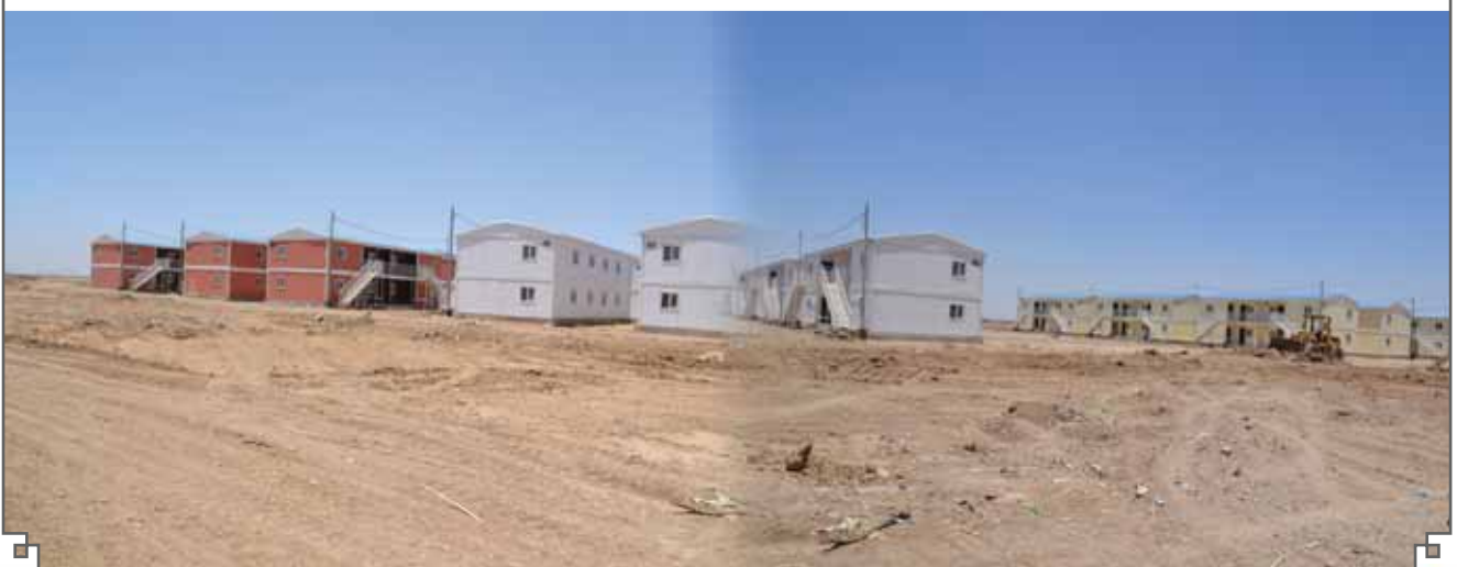
الشكل(٥):- صورة للمنطقة المحيطة بالمجمع السكني في واسط

يرى التحالف انه من المهم ان يشمل عقد بناء مجمع سكني واطيء الكلفة كافة الاعمال المتعلقة بالمجمع ومنها توفير البنى التحتية للمجمع مثل تبليط المساحات المحيطة والطريق المؤدية اليه ومد شبكة المجاري وتصريف مياه الامطار وغيرها من المنشآت ذات العلاقة، ولكن الحاصل فعلا هو ان المحافظة تعاقدت مع شركة الرضوان لبناء المجمع وتعاقدت مع شركة اخرى لتنفيذ اعمال البنى التحتية وتعاقدت مع شركات اخرى لبناء المنشآت الباقية كالمدارس ان التعاقدات المتعددة والمزدوجة لا تتيح انجاز الاعمال بصورة متزامنة بحيث ينتهي المجمع وكل ملحقاته مرة واحدة ويمكن افتتاحه في موعد واحد، فماهي اهمية انتهاء بناء المجمع منذ ٩ اشهر ولم يباشر لحد الان بتبليط المساحات وربط شبكات الصرف الصحي وإنارة الشوارع وغيرها حيث يبين الشكل(٥) ان المنطقة المحيطة بالمجمع ترابية ويتعذر السكن فيها، ونعتقد ان هذه التعاقدات المتعددة لنفس المشروع سببا في تأخير الاستفادة منه وهذا هو نوع من انواع الفساد حيث قامت شركة الرضوان التابعة لوزارة الصناعة والمعادن التي تعاقدت مع محافظة واسط لتنفيذ مشروع المجمع بالتعاقد مع شركة تركية لأجل انجاز المجمع، وكان من الأجر على المحافظة ان تتعاقد مباشرة مع الشركة التركية لأن عملية التعاقدات المزدوجة لمشروع واحد تتزامن مع مضاعفة كلف الاعمال لتوفير هامش ربحي لكافة الاطراف المتعاقدة وذلك قد يكون على حساب النوعية مما يبرر امتناع اللجان الاولية من استلام المجمع.